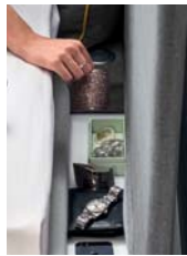
Portagioie Jewelry Box Porte-bijoux p. 376

La couture, qui a un impact esthétique net et fort, dessine les bords des coussins et de la structure du lit, et recrée un détail stylé et haute couture, jeune et contemporain.