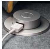
Porta USB USB holder Port USB p. 377